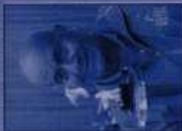
Sri Chinmoy zakladatel